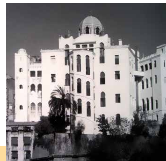
Médersa de Constantine

17h15 discussion 17h45 conclusions 18h00 fin du colloque