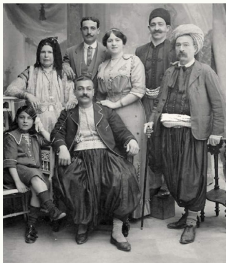
1914 FAMILLE ZAOUÏ