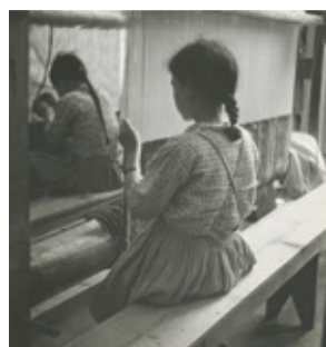
Fillettes installées au métier à tisser, vers 1937