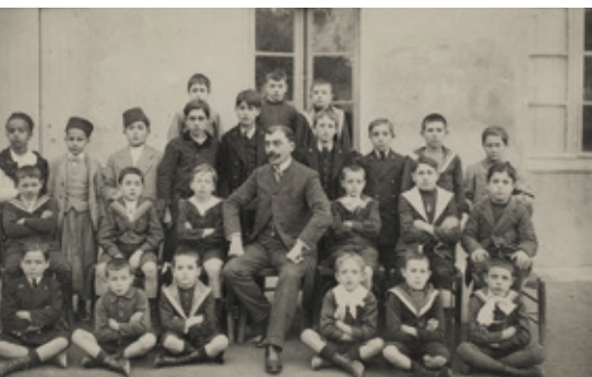
Photographie de la classe de neuvième du collège de Mostagadem (Algérie), Tourte et Petitin, 1913. Collections Musée national de l'Éducation.

Du 8 avril 2017 au 2 avril 2018, le Musée national de l'Éducation (Munaé) présente une exposition consacrée à « L'école en Algérie, l'Algérie à l'école », de 1830 à nos jours.