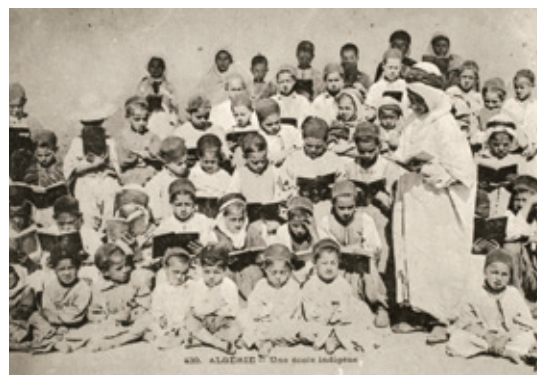
Algérie. Une école indigène, carte postale, vers 1910.