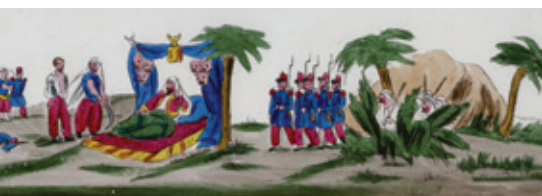
Prisonniers en Afrique/Guet-apens arabe, vue sur verre, vers 1860.

Le corpus de cette exposition est constitué de fonds conservés au Musée national de l'Éducation autour de la représentation de l'Algérie dans les manuels scolaires, les travaux d'élèves, les couvertures de cahier, les planches murales ou encore la littérature jeunesse. Il puise aussi largement dans les fonds réunis à Montpellier et à Aix-en-Provence à l'Iremam en vue du projet, aujourd'hui abandonné, d'un musée d'Histoire de la France et de l'Algérie.