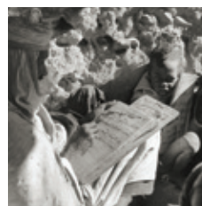
← École coranique de Reggan, 1937, photographie de Pierre Verger, Fonds Horizons de France, Le Visage de l'enfance . Collections Musée national de l'Éducation.

s'accomplira vraiment qu'après l'Indépendance avec l'aide de la coopération internationale. Les limites et les injustices du dualisme scolaire avaient cristallisé le débat politique et culturel algérien entre les deux guerres et stimulé le « malaise algérien ». Les réformes, trop tardives, n'empêcheront pas le « problème algérien » de mûrir dans la violence.