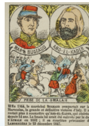
← « Bugeaud, Abd el-Kader, prise de la Smalah », illustrations extraites de : Histoire de France illustrée de 416 dessins par Jules Pacher , Pont-à-Mousson, Imagerie patriotique Louis Vagné, 1901.

Aujourd'hui, l'héritage de l'école reste un enjeu important des rapports entre les sociétés, de part et d'autre de la Méditerranée. Revenir dessus permet d'inscrire dans un cadre historique commun les diverses mémoires générées par les relations franco-algériennes.